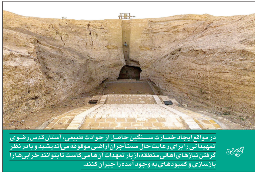
در مواقع ایجاد خسارت سنگین حاصل از حوادث طبیعی، آستان قدس رضوی تمهیداتی را برای رعایت حال مستأجران اراضی موقوفه می‌اندیشید و بارش تگرگ را در نظر گرفتن نیازهای اهالی منطقه، از بار تعهدات آن‌ها می‌کاست تا بتوانند خرابی‌ها را بازسازی و کمبوهایی به وجود آمده را جبران کنند.

قدر نقصان در محضر به عنوان تخمین نوشته شده، تخفیف وجه اجاره مقرر داشته به اسم مستأجر مزرعه مزبوره برات بنویسند». افزون بر تخفیفات اجاره برای آسیب‌دیدگان از حوادث طبیعی، معمولاً تمهیداتی نیز برای احیای زیرساخت‌ها در نظر گرفته می‌شد؛ هر چند در مورد این سند، گزارشی از چنین اقدام‌هایی در دسترس نیست.