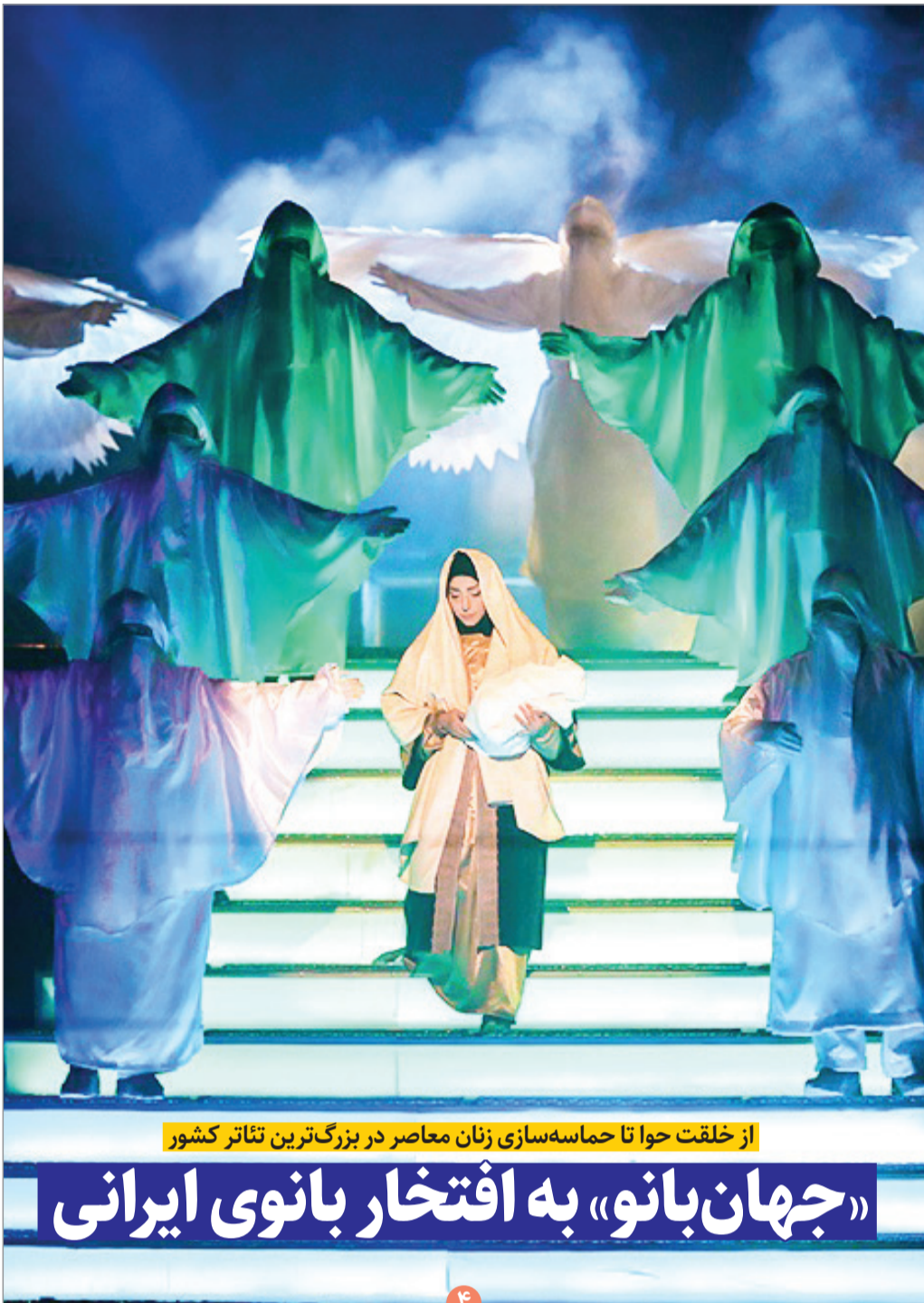
از خلقت حوا تا حماسه‌سازی زنان معاصر در بزرگ‌ترین تئاتر کشور