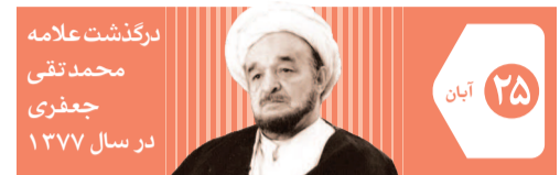
درگذشت علامه محمد تقی جعفری در سال ۱۳۷۷